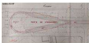
1898 – Porte de Vincennes