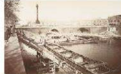
1899 - Bastille