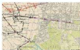
1930 – Extension