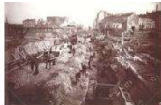
Gare de Lyon