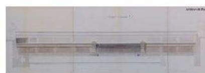
1898 – Bastille (vue de côté)