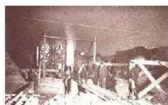
1899 - Nation