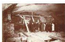
1899 – Reuilly