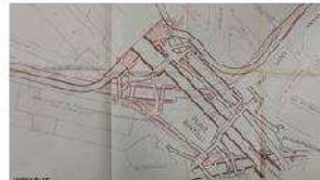
1942 – Projet Bastille