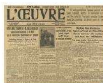
Bastille – accident