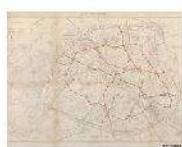
1896-11 – L1