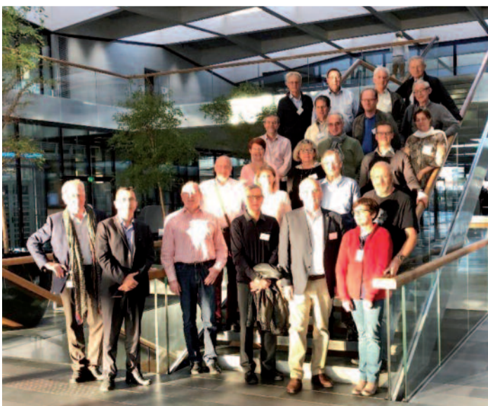
Le groupe des ingénieurs en visite industrielle chez Hager

Assurément. Dans le sud, un pôle industriel dominant est l'automobile (PSA) à Sochaux, Montbéliard, Mulhouse, mais aussi Alstom pour les trains à Belfort, avec leur riche tissu de sous-traitants. Plus au nord dans le Bas Rhin, 9 des 500 plus grosses entreprises ont un CA dépassant 700 millions d'€. ■