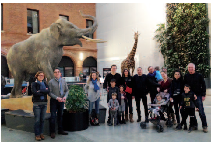
Belle sortie au Muséum de Toulouse